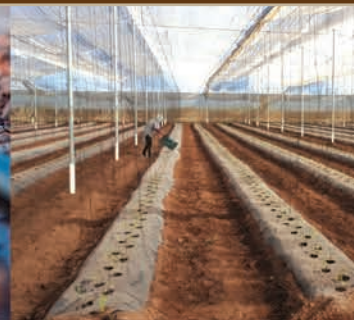
Desinfección de sustratos