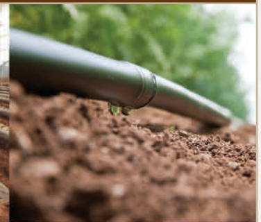
Lavado de camas