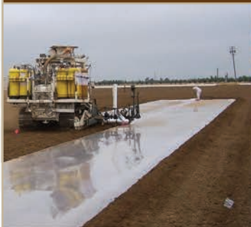
Desinfección de suelos